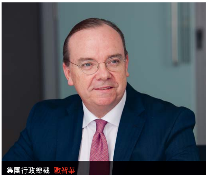
集團行政總裁 歐智華

我們擁有多元而全面的銀行業務模式和緊密聯繫的環球網絡，既可有效服務客戶，更能夠為投資者帶來領先同業的回報。